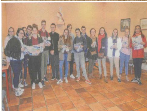
Samedi matin, les lycéens prêts à partir distribuer les flyers de la programmation culturelle municipale et les plans.